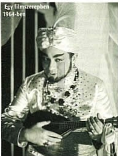
Egy filmszerepben 1964-ben

Megszállott, érzelmes, hisztérikus, öngyötörő, önimádó, alázatos, cinikus, nagyképpű, sértődékeny, tüneményes, imádni és gyűlölni való figurák.