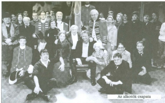
Az alkotók csapata

Immár tartós sorozatban látható a Soproni Petőfi Színházban és a Kamaraszínházban a Valló Péter nevűvel fémjelzett munkásság gyümölcse: egy sor előadás, melyek mindegyike tagadhatatlan élmény, szórakoztat és elgondolkodtat, hagyományos és nem bántó