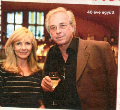
40 éve együtt

játszottunk együtt, és ez a játszótársi kapcsolat még intenzívebbé teszi az együttlétünket. Minden hamisságot, álságot, szabálytalanságot rögtön leleplez. Mert játszani csak nagyon őszintén, tiszta lélekkel lehet. Időnként észreveszem az unokáknál, hogy ha mondjuk játszózás közben a bős oroszlánt csak vad üvöltéssel, heves mozdulatokkal, de nem teljes odaadással jelenítem meg, rögtön szólnak, és teljesen jogosan