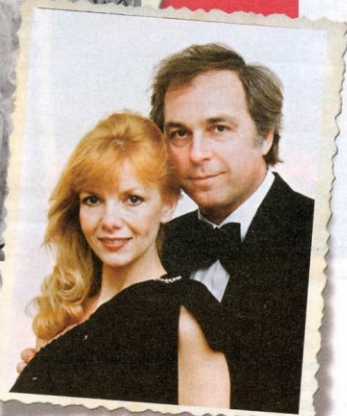
Pár évvel később....