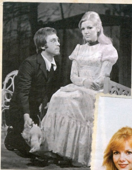
Az a bizonyos szerelmes Sirály-előadás