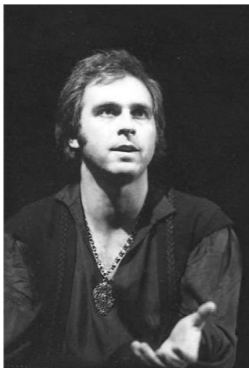
Huszti Péter Hamletként

1992-től a Nemzetközi Színházi Intézet Magyar Központjának alelnöke, 1993-tól a Magyar-Brit Társaság elnöke, 1998-tól a Széchenyi Irodalmi és Művészeti Akadémia tagja, 2003-tól a Kossuth- és Széchenyi-díj-bizottság tagja. Munkássága elismeréseként Kossuth-díjat, Jászai Mari-díjat (1974) és Hevesi Sándor-díjat (2003) is kapott. 1983-ban érdemes művész, 2004-ben kiváló művész lett, 2002-ben Apáczai Csere János-díjban részesült oktatói tevékenységéért. 2010-ben munkájának elismeréseként a Marosvásárhelyi Művészeti Egyetem díszdoktorának fogadta.