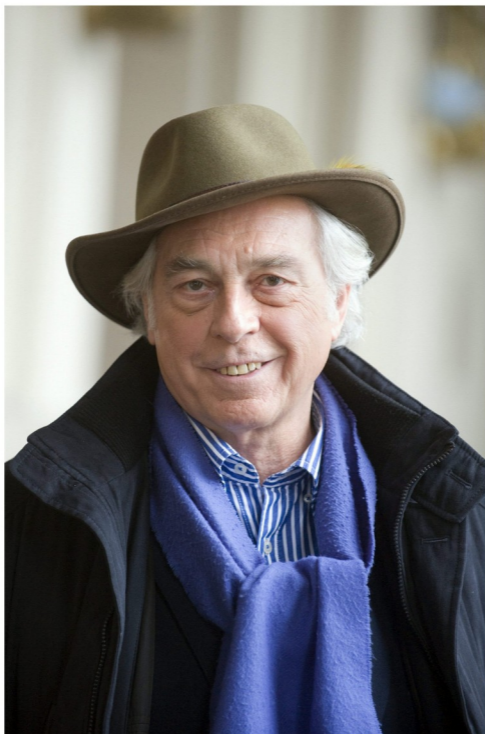
Huszti Péter Kossuth-díjas színművész, rendező 2015-ben