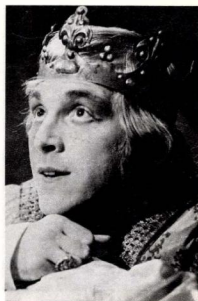
Szomorú Deszda: II. Lajos király

nöttek lettek: gyerekekkel, feleséggel, anyóssal, megcsontosodó szokásokkal.