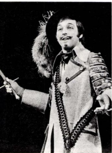
Shakespeare: Lóvá tett lovagok