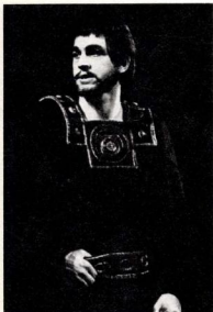
Bánk bán, 1966. Színművészeti Főiskola