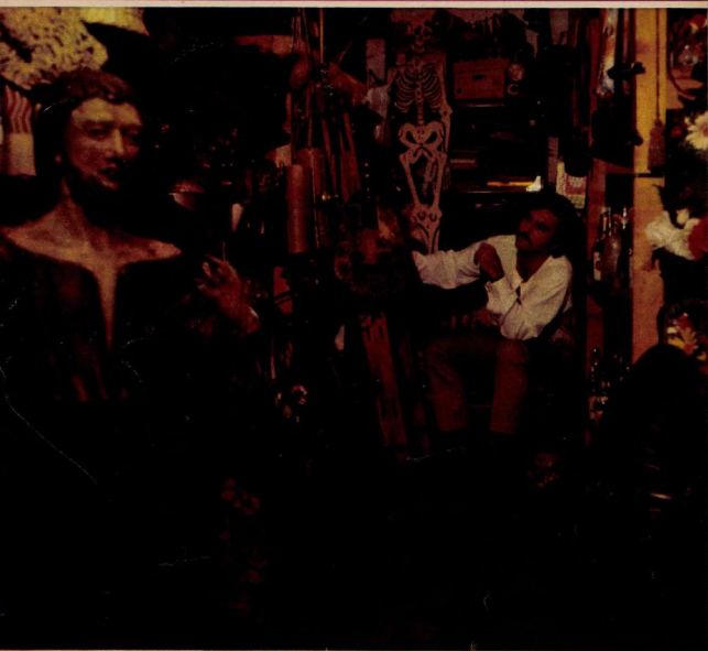
A kelléktár ma a hajdani ruhásszekrény-színházra emlékeztet