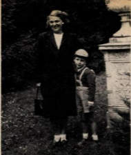
A ruhásszekrény főrendezője Edesanyámmal nyaraláson (fent)

Amikor a gimnáziumba beléptem Osztyájkép a Lorántffy Zsuzsanna ál- talanos iskolában. Felső sorban jobbról harmadikként állok (középen)