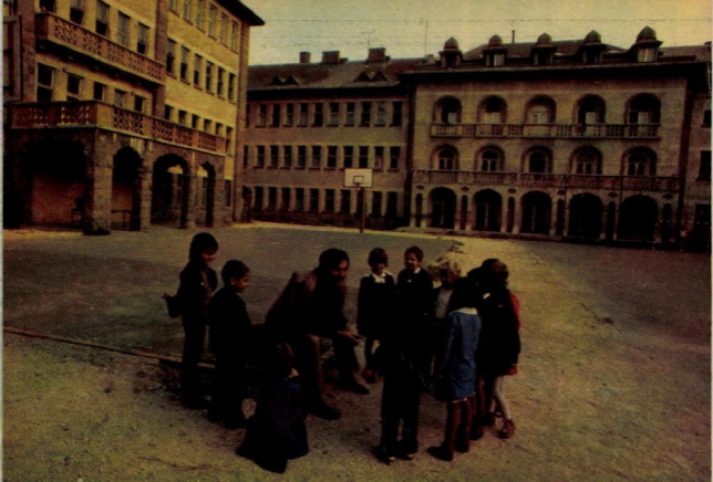
Első iskolám udvarán